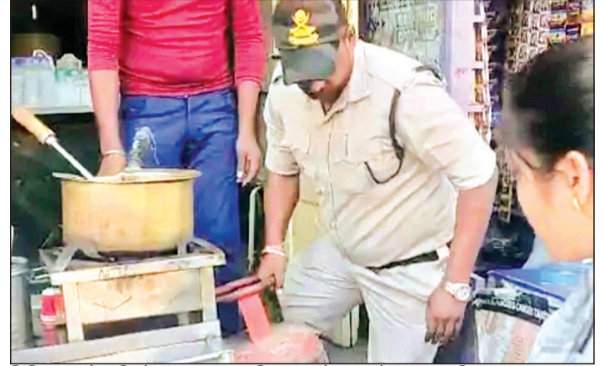
विदिशा। घरेलू सिलेंडर का व्यवसायिक उपयोग करने पर जब्त किया गया।