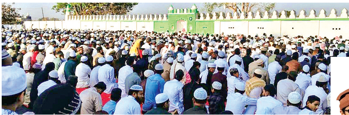
शहर काजी ने दिया एकता अखंडता भाईचारे का संदेश, जिले की तरक्की के लिए मांगी दुआएं

नवरात्रि पर तीन दिन से मंदिरों में हो रहे मजान दीवानगंज। चैत्र नवरात्रि का पावन पर्व श्रद्धा और उत्साह के साथ मनाया जा रहा है। मंदिरों में भजन कीर्तन का आयोजन चल रहा है। नवरात्रि को लेकर मंदिरों में करीब 15 दिन पहले से रंग-रोगन कराया गया। मंदिरों को आकर्षक तरीके से सजाया गया। गांव-गांव में विशेष पूजा-अर्चना चल रही है। कई जगह धार्मिक अनुष्ठान हो रहे हैं। खेड़ोपति हनुमान माता मंदिर दीवानगंज, अंबाडी और सेमरा में सुबह से ही श्रद्धालु पहुंच कर जल अर्पित कर पूजा-अर्चना कर रहे हैं। मंदिरों में मातारानी की ज्योत जल रही है और सेवक सेवा कर रहे हैं।