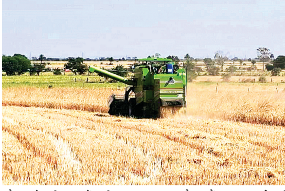
और चने की फसलें पूरी तरह पककर तैयार हैं। शुक्रवार को हुई

नगर सहित आसपास के ग्रामीण क्षेत्रों में शनिवार को लगातार दूसरे दिन मौसम का मिजाज बदला हुआ नजर आया। आसमान में बादलों ने अपना डेरा जमाए रखा, रुक रुक कर तेज हवा चलती रही। मौसम के इस अनिश्चित व्यवहार ने किसानों की चिंता बढ़ा दी है, जिसके चलते वे अपनी पकी हुई फसलों को सुरक्षित समेटने की कवायद में जुट गए हैं। किसानों के अनुसार, गहू