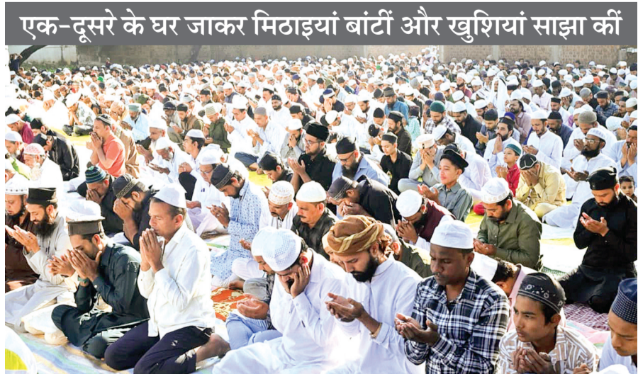
एक-दूसरे के घर जाकर मिठाइयां बांटीं और खुशियां साझा कीं